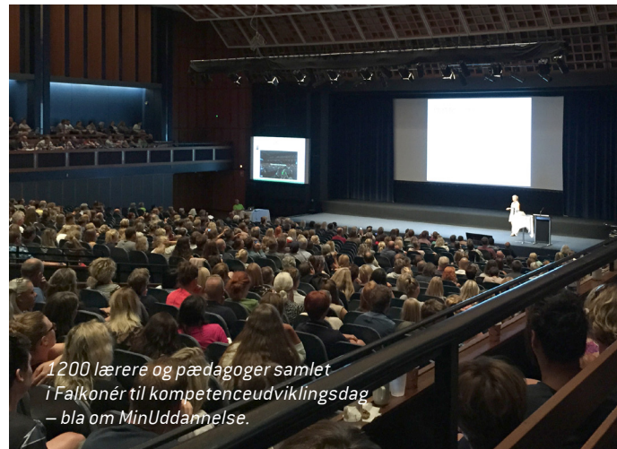
1200 lærere og pædagoger samlet i Falkonér til kompetenceudviklingsdag – bla om MinUddannelse.

På langt de fleste skoler har ledelsen sidste år kun tillagt +7 timers arbejde og undervisningstillæg for lejrskoler. Forvaltningen er enig med FLF i at dette tal skal være 14 timer. Har du kun fået +7 timers undervisningstillæg eller arbejde tillagt din opgaveoversigt, skal du kontakte din skoleleder, således at du kan få den rette løn udbetalt. Hvis der på dette års opgaveoversigt igen kun står +7 timer pr. døgn, skal du også kontakte din leder. Har du spørgsmål, kontakt da din TR.