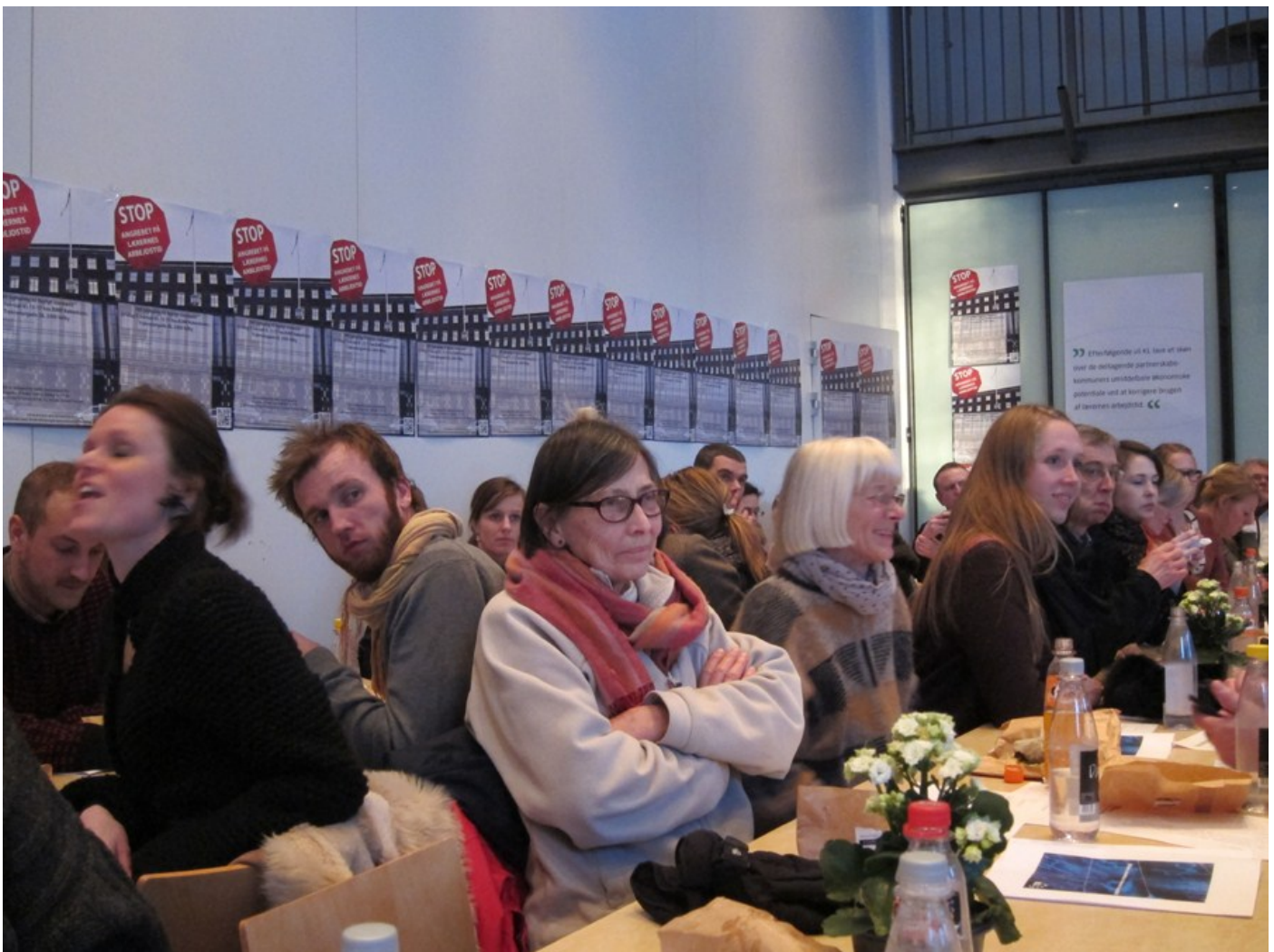
Mere end 150 lærere og børnehaveklasseledere var mødt frem til fagligt stormøde tirsdag d. 7. februar.

Indlæg (artikler, billeder osv.) sendes til anja.hyldgaard.pedersen@skolekom.dk