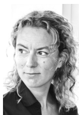
Af Ane Søegaard

Mandag den 27. februar besluttede kommunalbestyrelsen på Frederiksberg som ventet at indgå et såkaldt partnerskab med Kommunernes Landsforening (KL) om "Effektivisering af lærernes arbejdstid". SF og Enhedslisten stemte som de eneste partier imod forslaget.