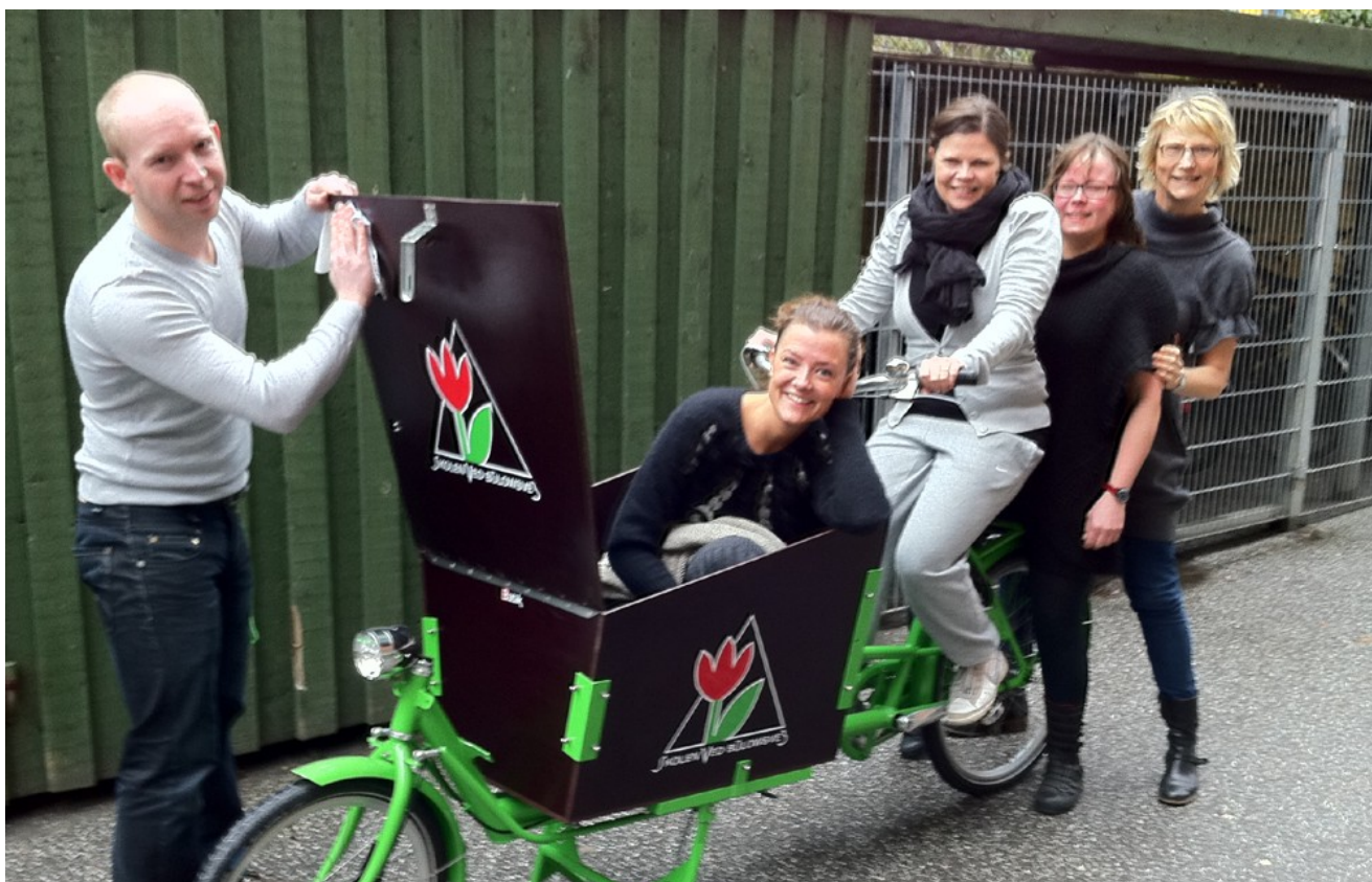
Den flotte nye ladcykel sponsoreret af personaleforeningen

Personaleforeningen har været og er en kæmpe succes og vi kan kun anbefale andre skoler at lave noget tilsvarende!