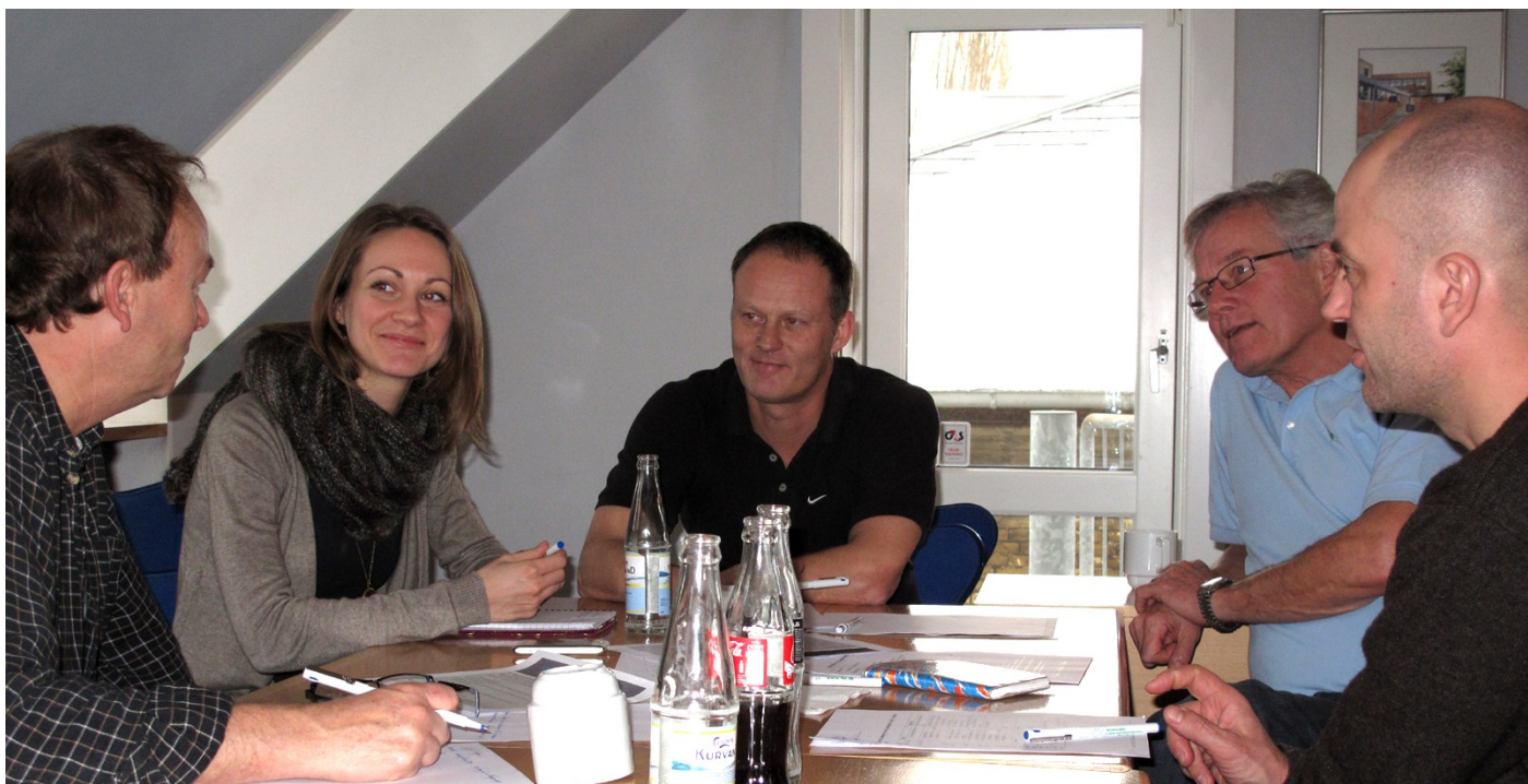
En gruppe på temadagen. Der arbejdes engageret på at forbedre trivslen.

Deadline for næste nummer af FKF-Nyt er den 4/2 Indlæg (artikler, billeder osv.) sendes til anja.hyldgaard.pedersen@skolekom.dk