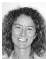
Af Ane Søegaard

Med julepostkort og klejner skød Frederiksberg Kommune-lærerforening i december sin kampagne ”Styrk læreren – styrk skolen!” i gang.